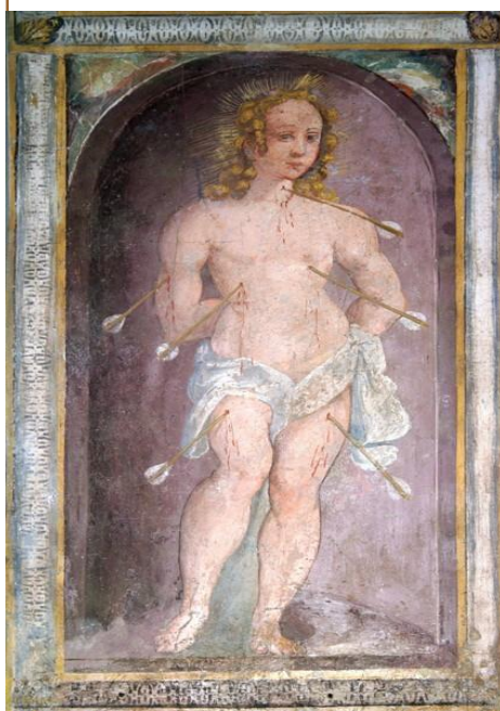
Raffigurazione di San Sebastiano (XVI secolo) Chiesa S.Maria del Riposo galleria centrale Bracciano

San Sebastiano, patrono di Bracciano, si celebra il 20 gennaio, da alcuni anni è ripresa la tradizione di festeggiarlo anche la prima domenica di maggio, quest'anno sabato 30 Aprile.